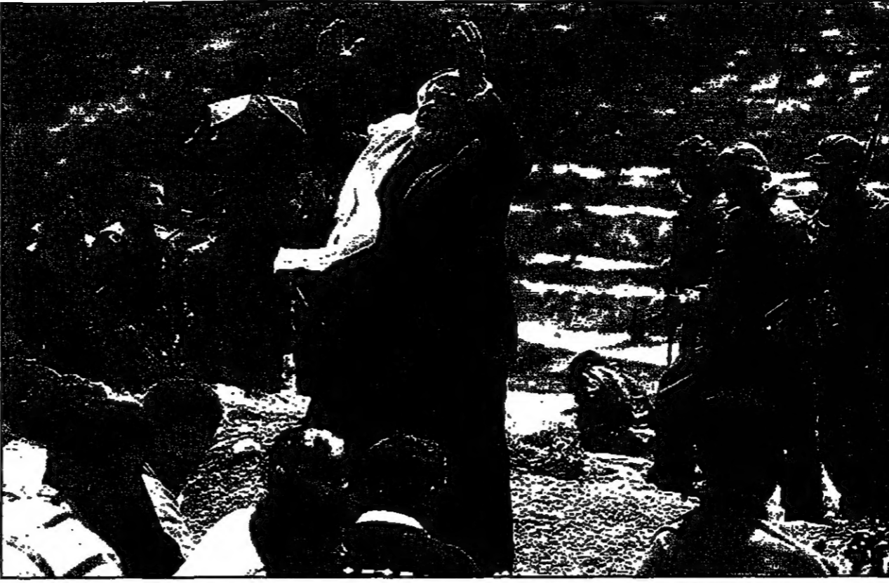
جنود اسرائيليون يراقبون متظاهرين يستعملون لغة سبائية الصلابة على ارض يسطح للمستوطنين الاستيطان عليها في منطقة نابلس

نابلس - اف ب: قام متظاهرون فلسطينيون ظهر الجمعة بمسيرة في جبل التوبة في محافظة نابلس في الضفة الغربية لتتبعوا خلالها اربعة هكتارات كان مستوطنون يهود قد ضموها في وقت سابق.